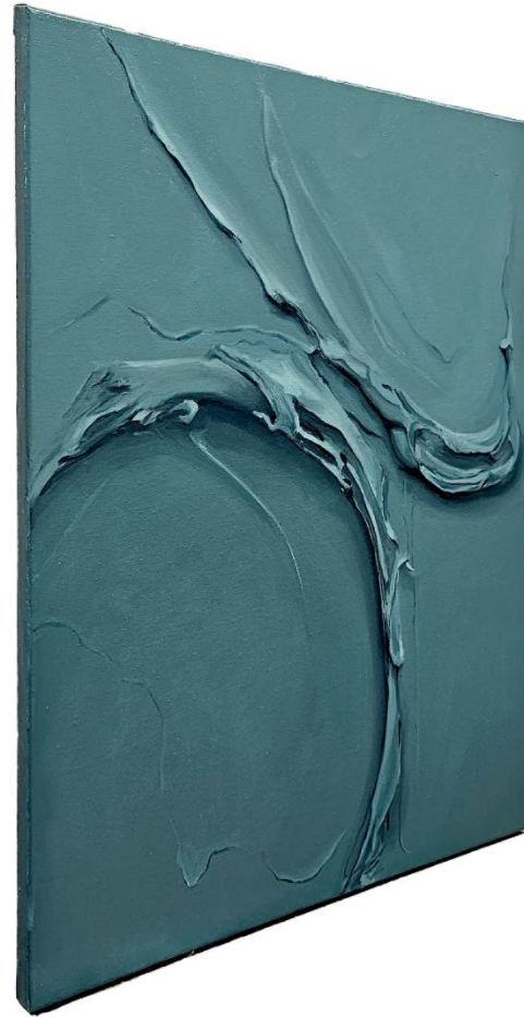
MEDITERRANEO Óleo sobre lienzo 60 x 50 cm