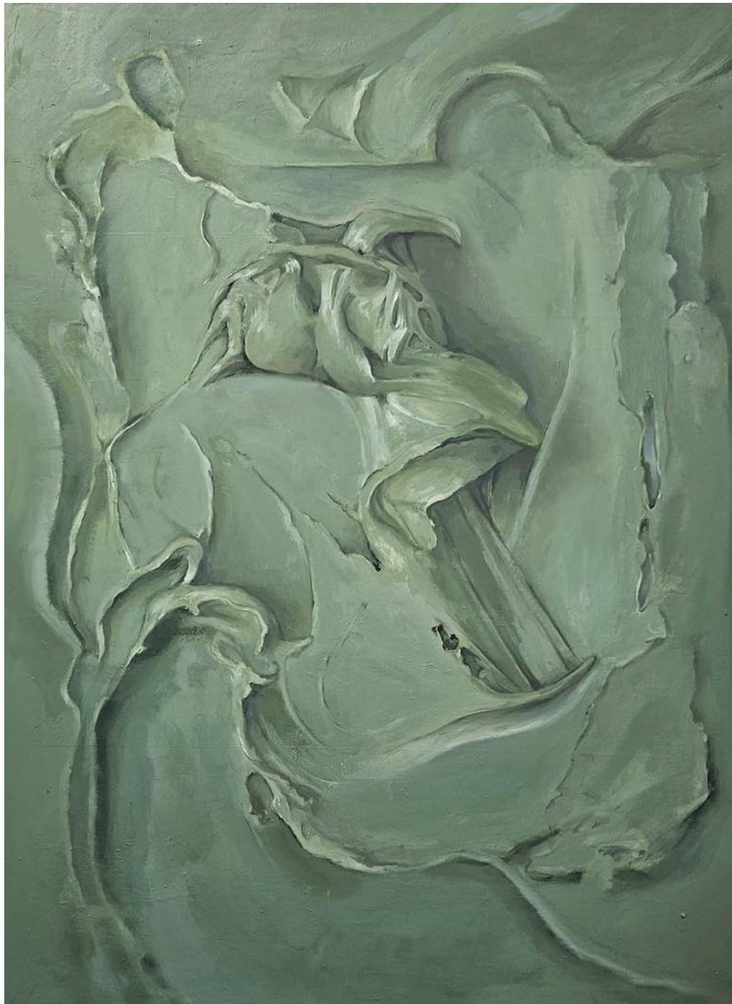
HUNTER GREEN Óleo sobre lienzo 130x97cm