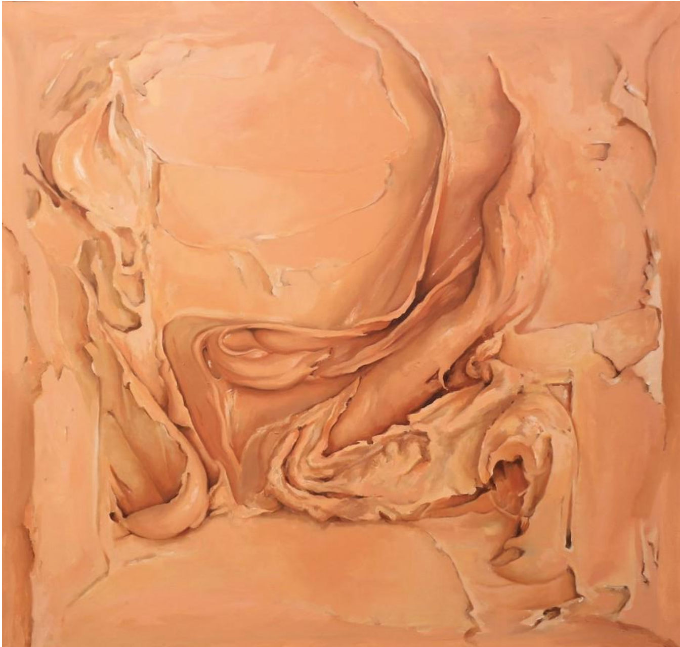
DUSTY ORANGE Óleo sobre lienzo 116x116cm