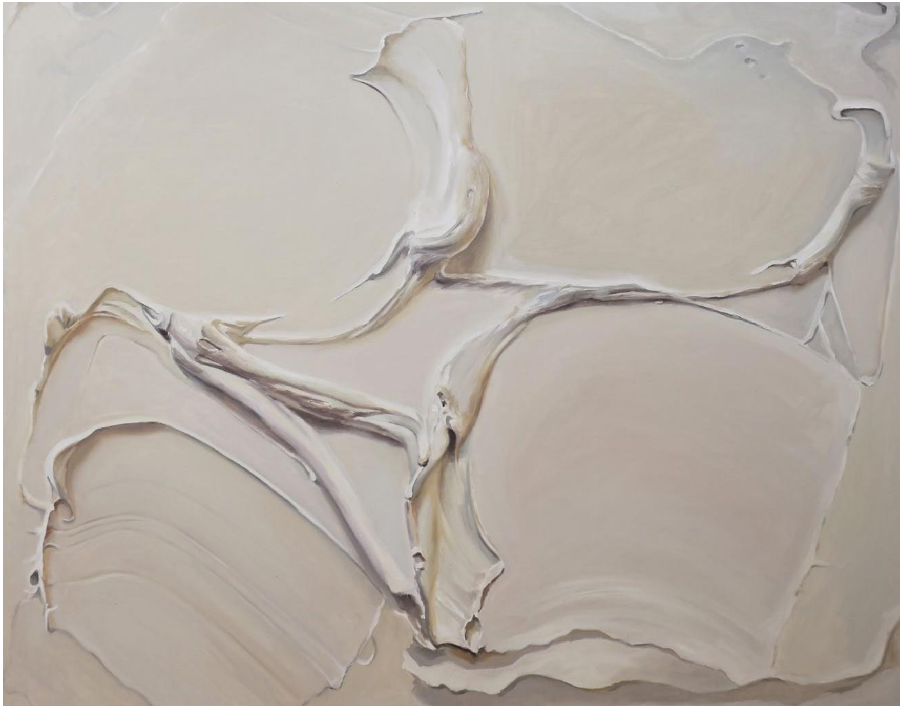
SILENCE Óleo sobre lienzo 163x130cm