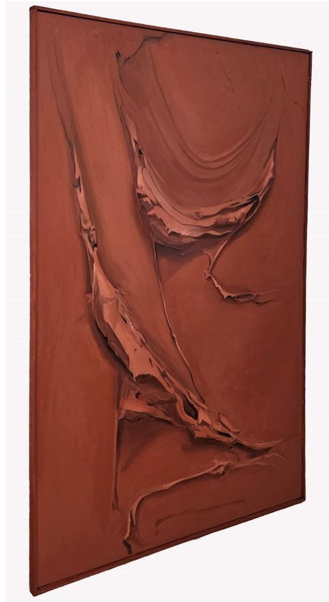
BURNT RED Óleo sobre lienzo 146x114cm