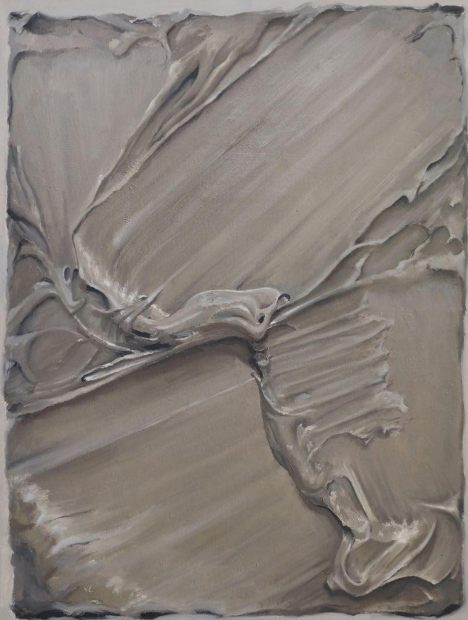
CHOCOLATE BROWN Óleo sobre lienzo 92x60cm