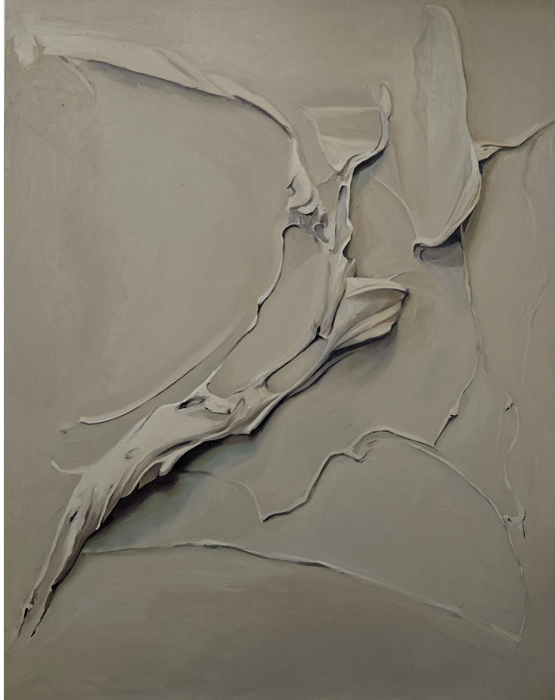
SAND Óleo sobre lienzo 163x130cm