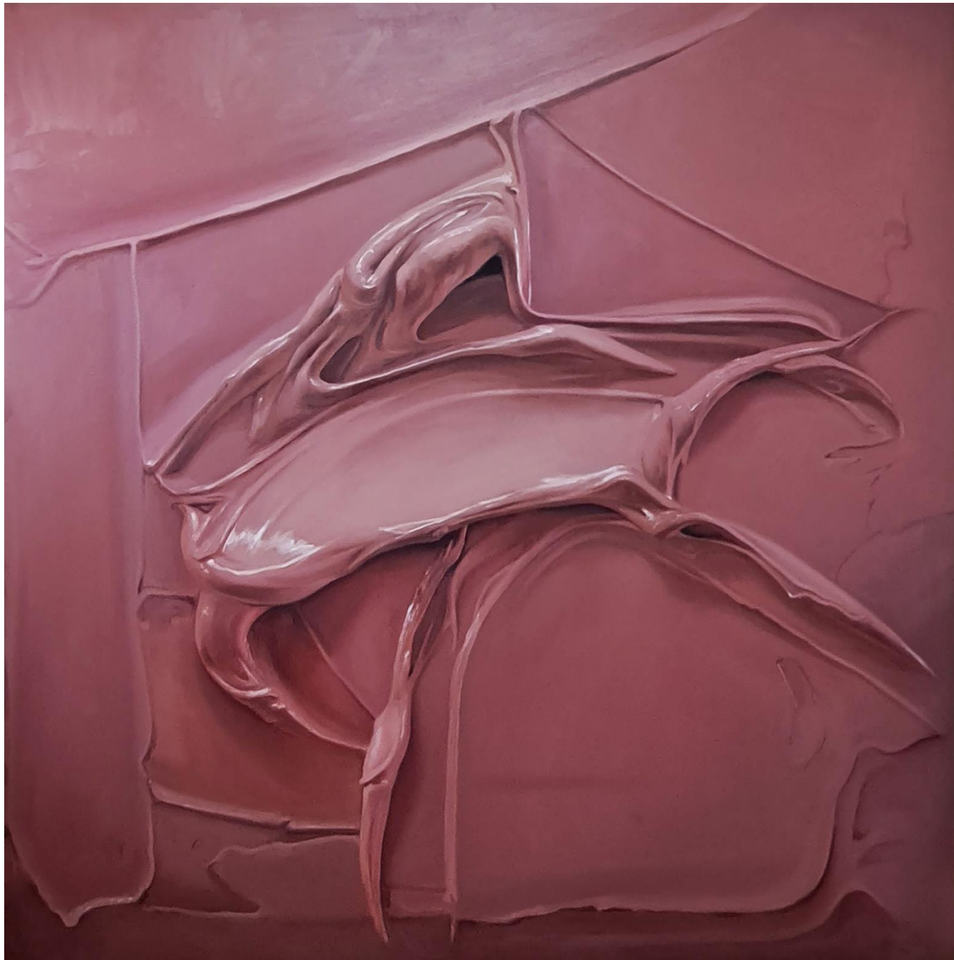
MAUVEWOOD Óleo sobre lienzo 200x200cm