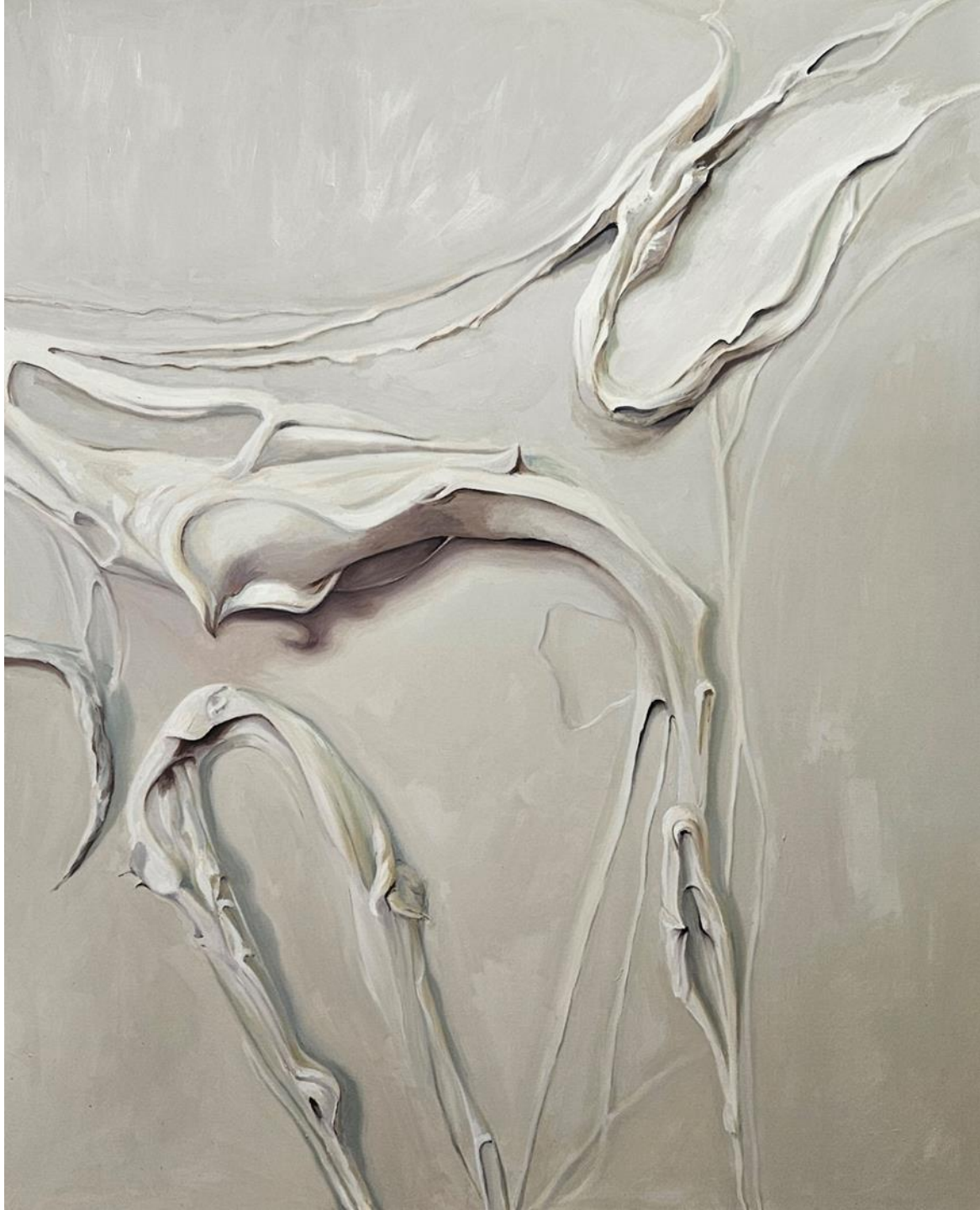
WARM GRAY 2C Óleo sobre lienzo 163x130cm