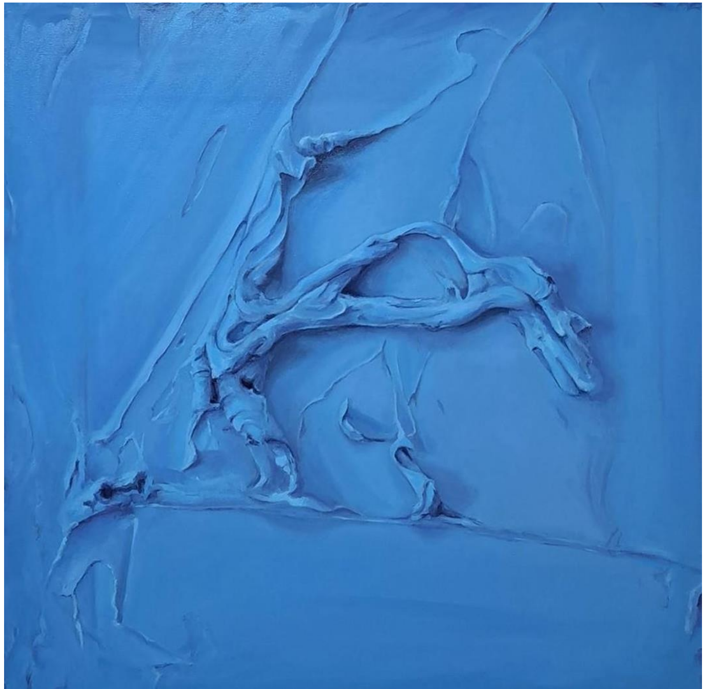
SAPPHIRE Óleo sobre lienzo 100x100cm