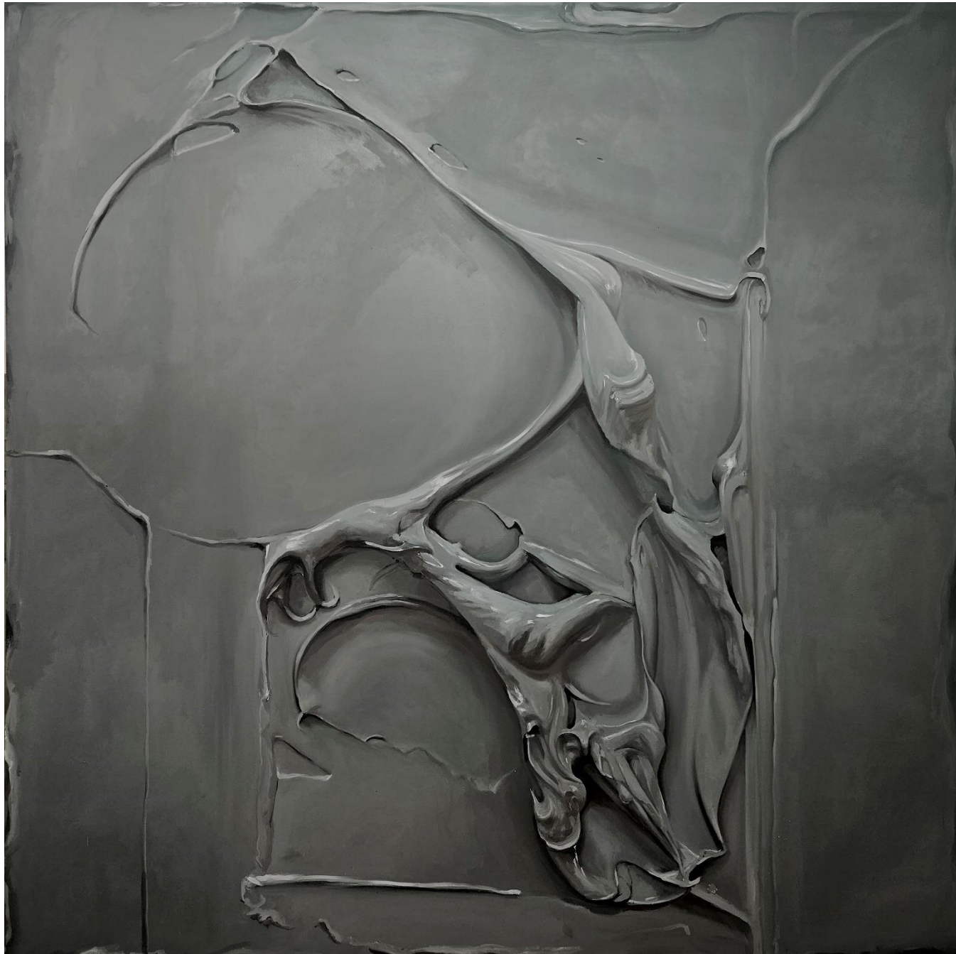
POPPY SEED Óleo sobre lienzo 200x200cm