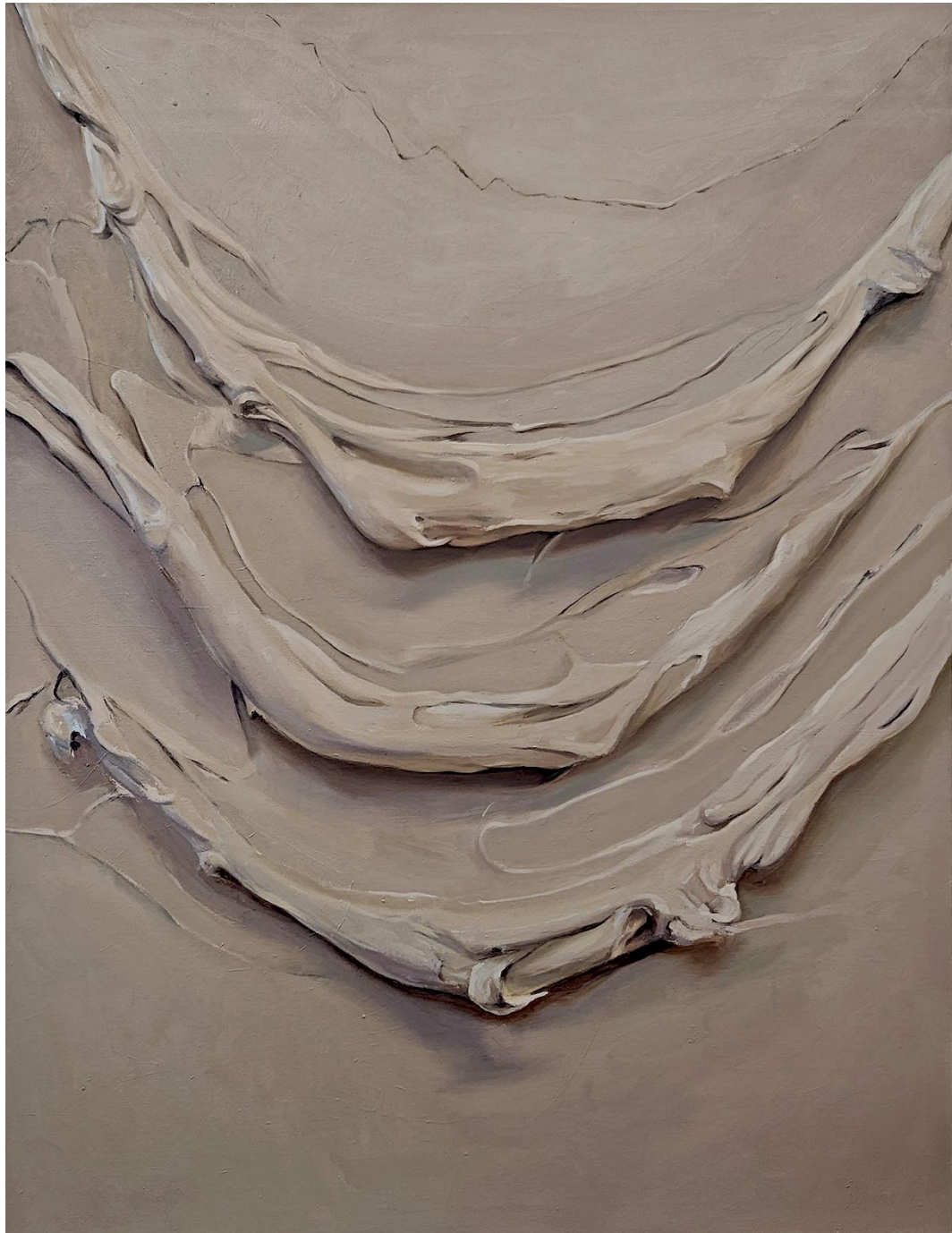
SAND WAVES Óleo sobre lienzo 130x97cm