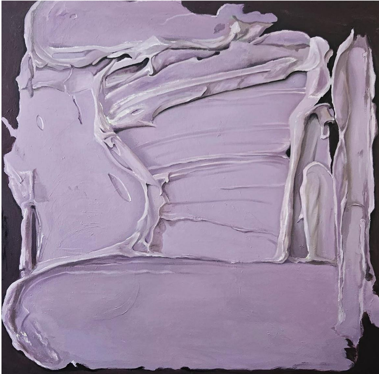
ELDERBERRY Óleo sobre lienzo 116x116cm