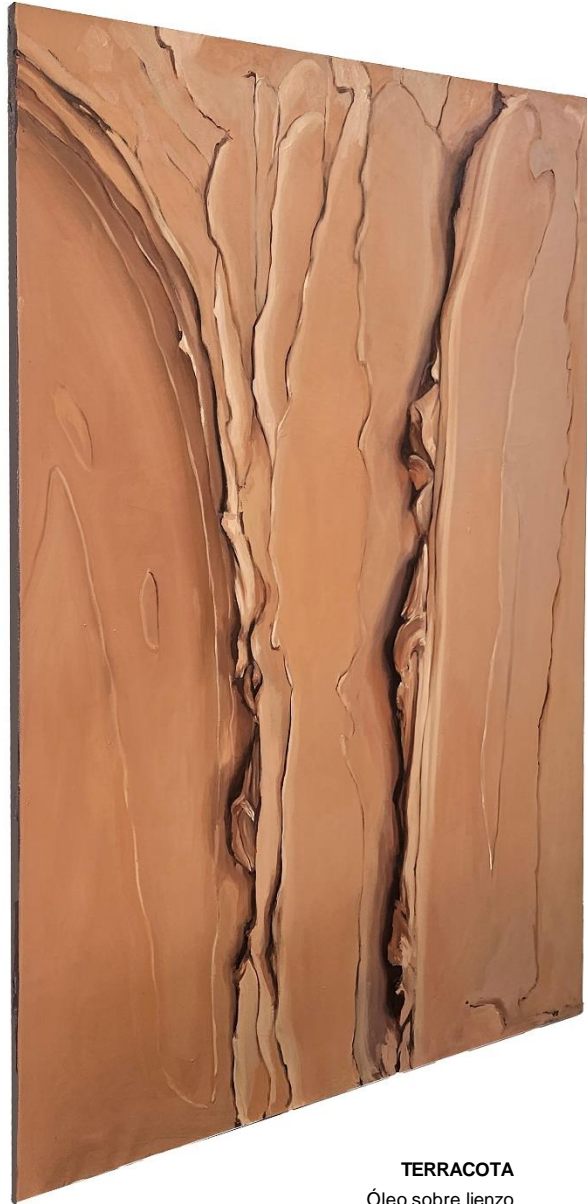
TERRACOTA Óleo sobre lienzo 116x116cm