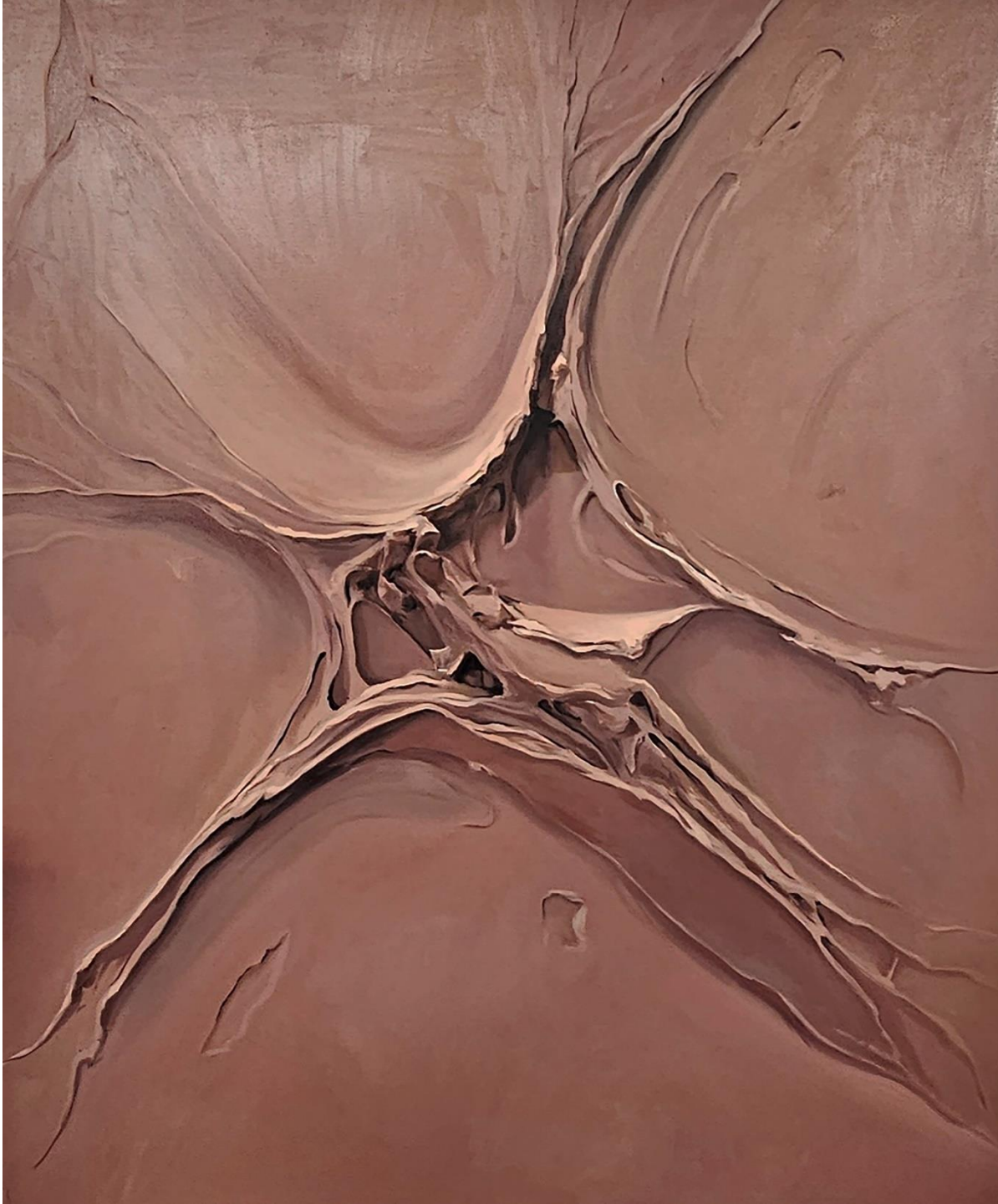
BURNT BRICK Óleo sobre lienzo 163x130cm