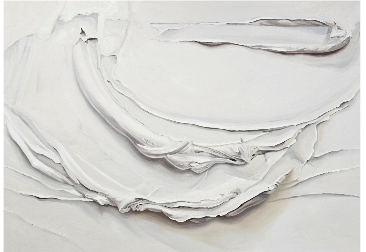
WAVES Óleo sobre lienzo 130 X 89 cm