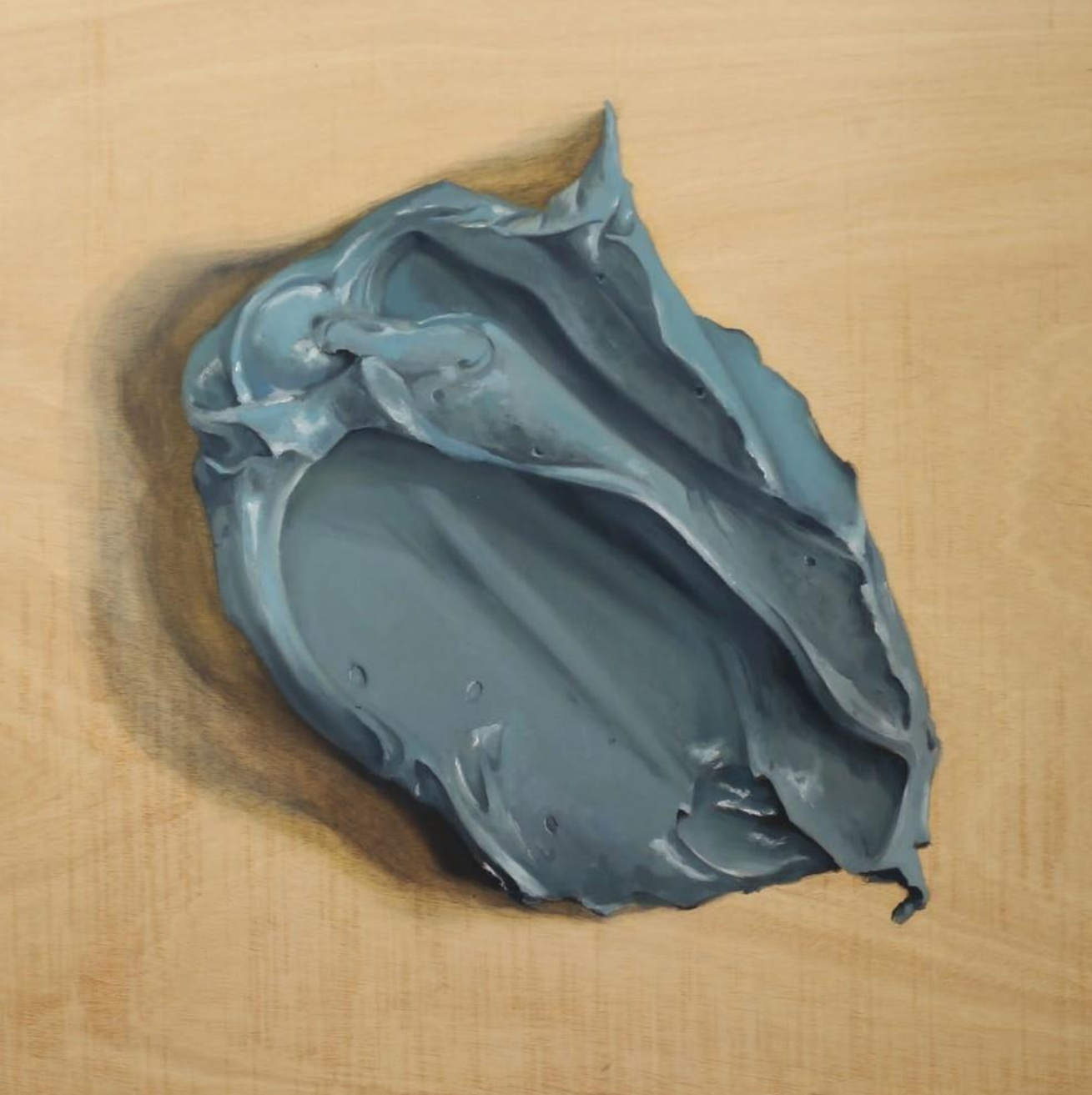
NAVY PEONY Óleo sobre madeira 100x100cm