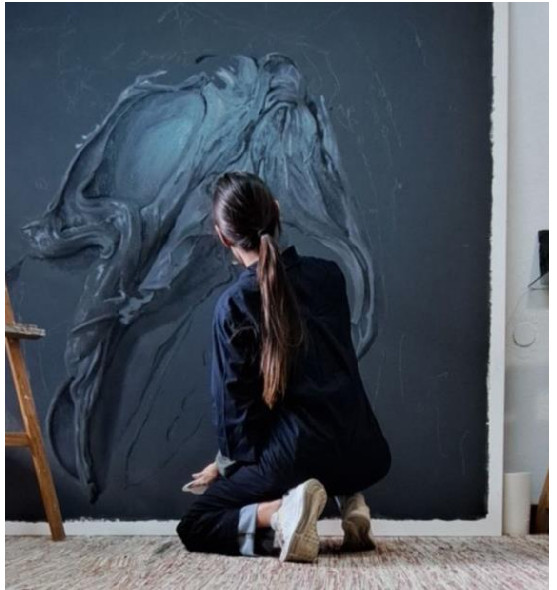
BLACK ONIX Óleo sobre lienzo 200x200cm