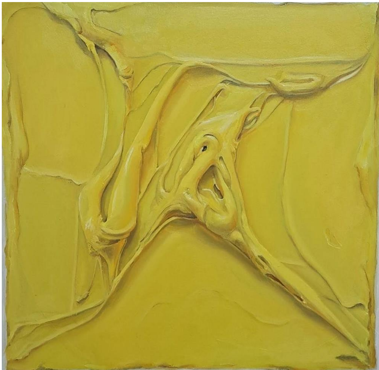
ILLUMINATING Óleo sobre lienzo 50x50cm